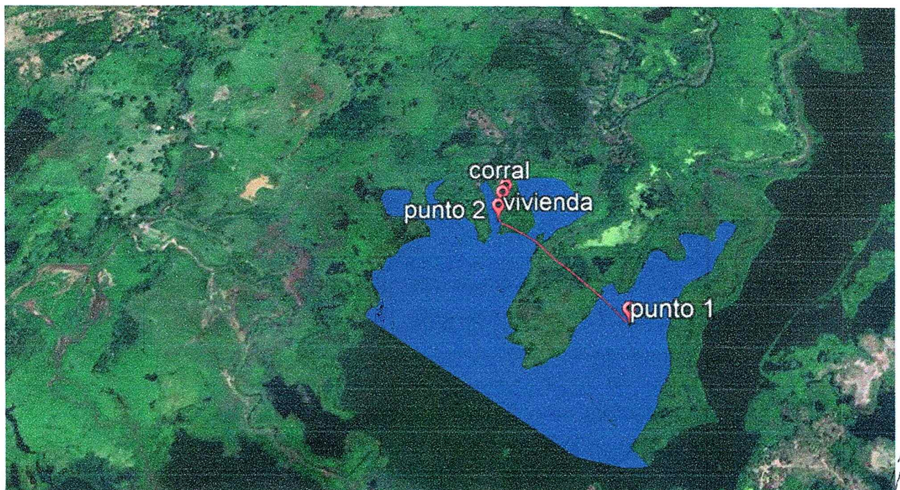
Figura 1. Imagen Google Earth. Puntos de la presencia de cerca eléctrica sobre la ciénega.